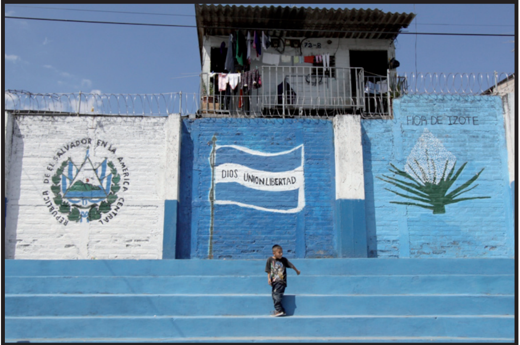
Foto realizada en un Centro Escolar del Municipio de Mejicanos durante las elecciones presidenciales de 2014, a pesar de que no se ven el elemento de la votación, los jóvenes son una parte importante en los procesos democráticos del país sin embargo las políticas educativas y de oportunidades para las nuevas generaciones de jóvenes son aún muy escasas y sus derechos son muy vulnerables ante los graves problemas de violencia y las pocas oportunidades laborales que afrontan.