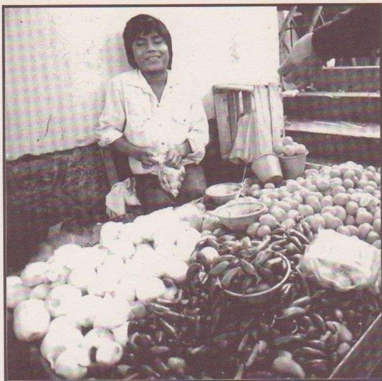
Vendedores del centro de San Salvador