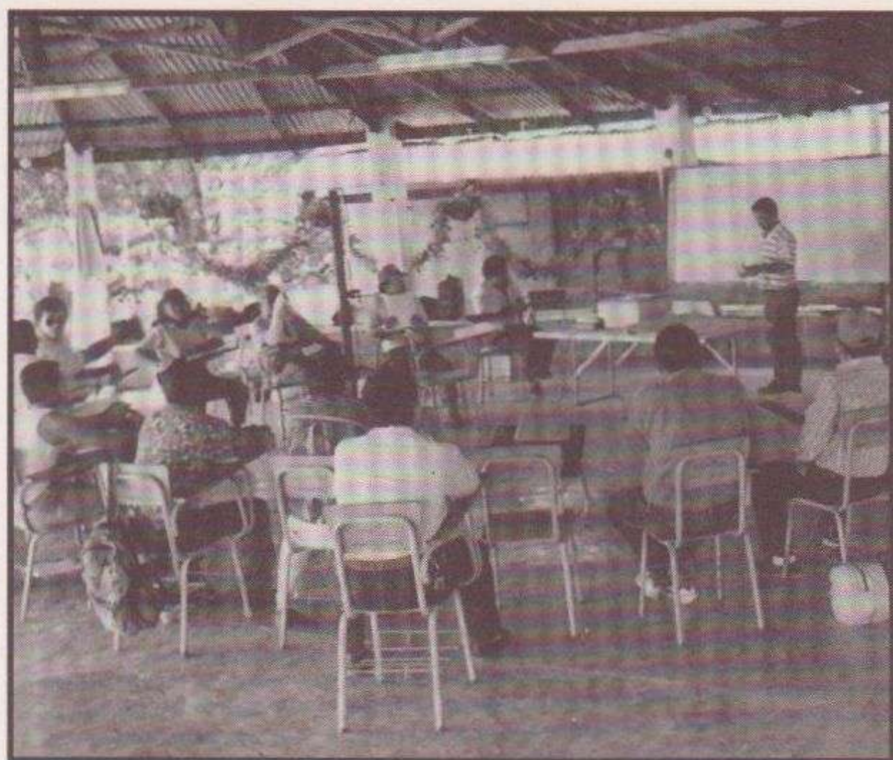
Jornadas de capacitación