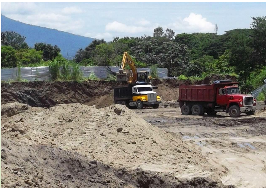
A la fecha de la visita y según el Programa de trabajo el Observatorio debió encontrar actividades de colado de concreto, desencofrado, relleno compactado y colocación de columnas. Julio 2013