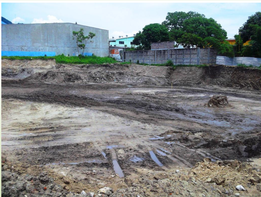
Según lo conversado con el personal de planta el material inadecuado, restos de ripio y aguas servidas, se estaban retirando del terreno. Julio 2013