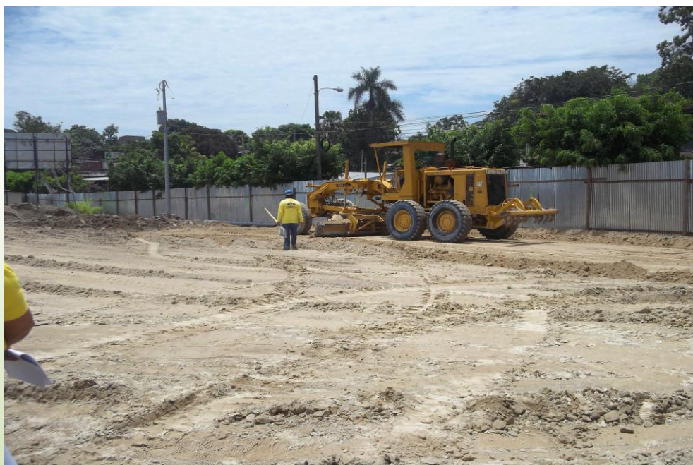
En el recorrido el Administrador de Contrato expresó que “las estructuras existentes ya habían sido desalojadas, las cuales fueron enviadas al sitio de disposición final autorizado en Bosques del Rio en Soyapango”. Julio 2013