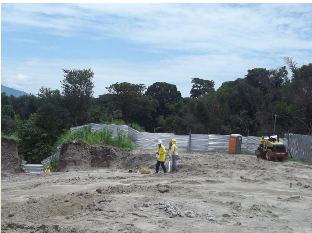
En la visita se observaron actividades de replanteo de líneas y niveles de referencia. Julio 2013