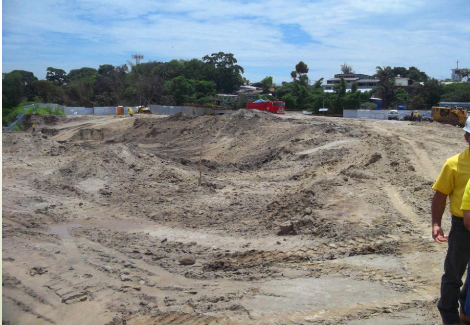
El Administrador expresó que se encontraban realizando los muestreos de suelo que servirán como banco de préstamo para el relleno masivo. Julio 2013

El Administrador expresó que “el material inadecuado y restos de ripio se estaban retirando del terreno”. En el recorrido se verificó que el área identificada como la más crítica por el contenido de basura se estaba removiendo.