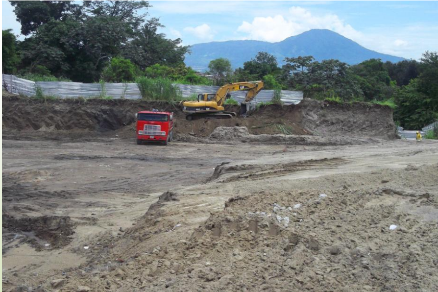
Las actividades de terracería, conformación de viales y andenes debieron completarse en el mes de abril, lo que reflejó que el proyecto llevaba un atraso real significativo. Julio 2013

Fue evidente el movimiento de las retroexcavadoras, camiones de volteo y personal, asimismo las estructuras existentes que se encontraban en el terreno habían sido demolidas. En la visita de campo anterior, se encontraban pisos de concreto y un muro de ladrillo.