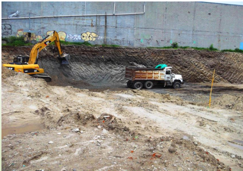
En la tercera visita de campo se observó que en el terreno se ejecutaban actividades de terracería. Julio 2013

En la visita se observaron procesos generales de excavación para las áreas de construcción y desalojo del material extraído. El Administrador explicó que “la excavación llegaría hasta el nivel de desplante indicado en los planos”. Se observó además que algunos trabajadores se encontraban en actividades de replanteo de líneas y niveles de referencia.