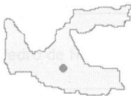
SANTA ROSA DE COPAN

Ubicada en la República de Honduras, tiene una superficie de 293.1 km 2 y una población de 42,545 habitantes, de los cuales el 51.5% son mujeres.