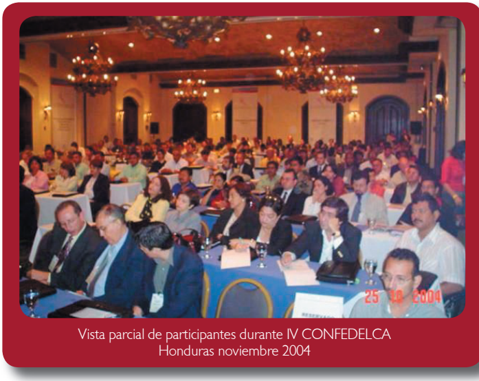
Vista parcial de participantes durante IV CONFEDELCA Honduras noviembre 2004

La Conferencia en Tegucigalpa, capital de Honduras, fue organizada por un comité amplio bajo la coordinación de la Secretaría de Gobernación y Justicia, integrado además por la Asociación de Municipios de Honduras (AMHON), la Red de Desarrollo Local, la Alcaldía de Tegucigalpa y el Consejo Hondureño de la Empresa Privada (COHEP).