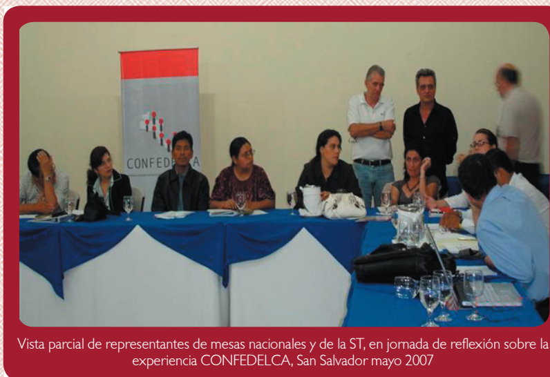
Vista parcial de representantes de mesas nacionales y de la ST, en jornada de reflexión sobre la experiencia CONFEDELCA, San Salvador mayo 2007

En Guatemala, la experiencia parece haber impulsado avances más concretos. El contexto que marcó el inicio de CONFEDELCA en este país estaba caracterizado por una lucha de dos tendencias: una comunitarista (con énfasis en el mercado que privilegiaba los procesos de privatización) y otra municipalista (que reivindicaba la autonomía). En el año 2000, la salida a esta confrontación fue iniciativa de la Presidencia y del Órgano Legislativo. La opción fue la búsqueda de alianzas con los principales actores involucrados en la dinámica del desarrollo local y la descentralización.