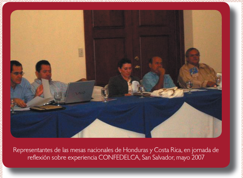
Representantes de las mesas nacionales de Honduras y Costa Rica, en jornada de reflexión sobre experiencia CONFEDLCA, San Salvador, mayo 2007

En los actuales momentos, parece que algunos avances estuvieron, en realidad, marcados por las elecciones que tendrían lugar en el 2006. Pocos meses antes de la celebración de la III CONFEDLCA en Nicaragua, en el mes de agosto, la Asamblea Legislativa aprobó la Ley de Transferencias a los Municipios. Esta normativa establecía un porcentaje del 6%, que se incrementaría a partir del 2007 a razón del 1% anual, hasta alcanzar el 10% en el año 2010. Después de un infructuoso intento del gobierno de Enrique Bolaños 7 por congelar las