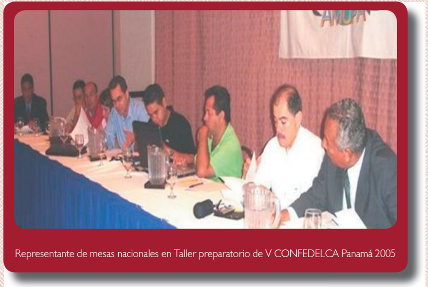
Representante de mesas nacionales en Taller preparatorio de V CONFEDLCA Panamá 2005