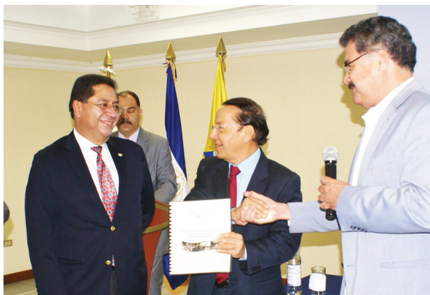
Entrega por parte de FUNDE del Balance en el tercer año de la gestión del Ministerio de Obras Públicas en el 2012.

Logrando una estimación de la efectividad de las medidas adoptadas por el MOP sobre la aplicación de la transparencia. La FUNDE formula las recomendaciones para fortalecer áreas débiles y consolidar las buenas prácticas.