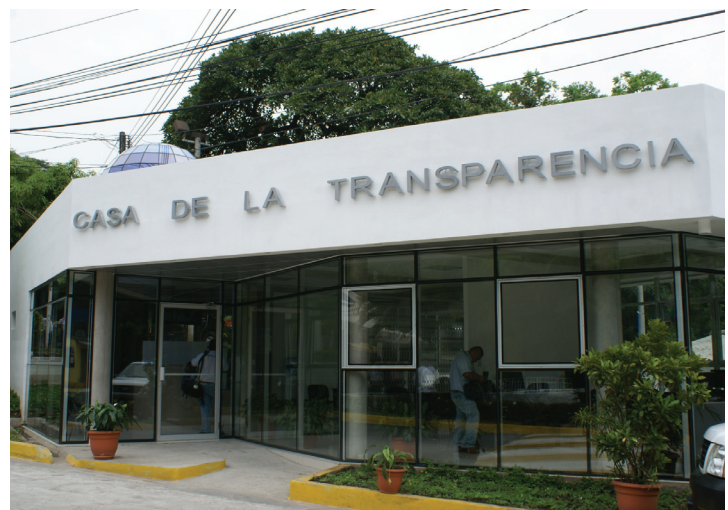
El Ministerio de Obras Públicas instaló la Casa de la Transparencia en el 2012.