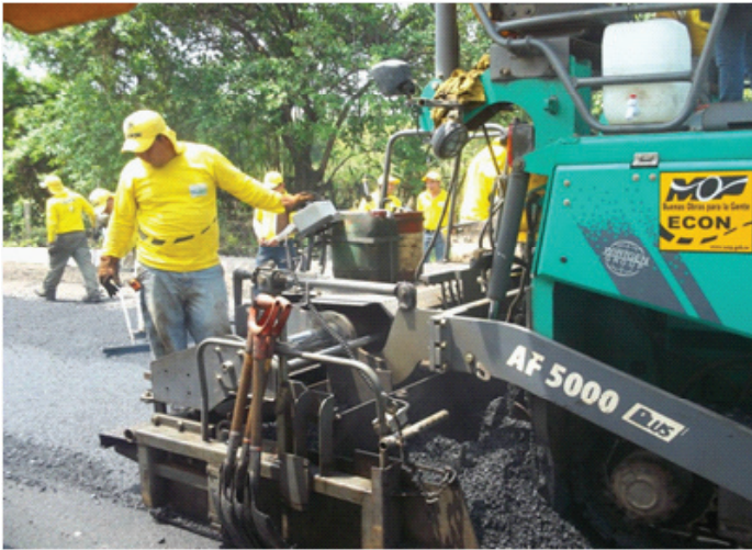
Construcción del By Pass en Usulután.

En 2009 y 2010, a pesar de mostrar voluntad para agilizar los proyectos de infraestructura pública, hubo dificultades para completar las licitaciones o iniciar la ejecución de los mismos. Varias licitaciones fueron declaradas desiertas. Fue hasta 2011 que se apreció una mejora en el nivel de ejecución a través de la dinamización de la inversión por parte del MOP. A pesar de que persisten dificultades, se percibe una gestión más ágil.