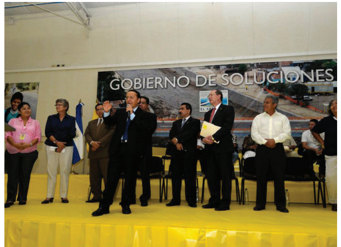
La rendición de cuentas del Ministerio de Obras Públicas, Transporte, Vivienda y Desarrollo Urbano en el 2012.

Por tres años consecutivos el MOP ha realizado eventos de rendición de cuentas. En 2012, como innovación, los eventos han tenido lugar en varias ciudades del país; el evento de San Salvador fue el 6 de junio 4 . La rendición de cuentas se adoptó para informar a la población, entre otros aspectos, sobre las obras públicas de infraestructura y mitigación de riesgos realizadas por la entidad y su contribución al desarrollo del sector construcción y la generación de empleos, así como las medidas de fortalecimiento institucional implementadas para mejorar la capacidad de respuesta del MOP a las demandas de la población.