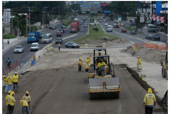
Construcción Boulevard Diego de Holguín

Se percibe que persisten atascos en los flujos de información entre las diferentes oficinas del MOP. Hay dificultades de articulación entre las unidades y áreas de la entidad en función del objetivo común, que es responder a las necesidades de la población.