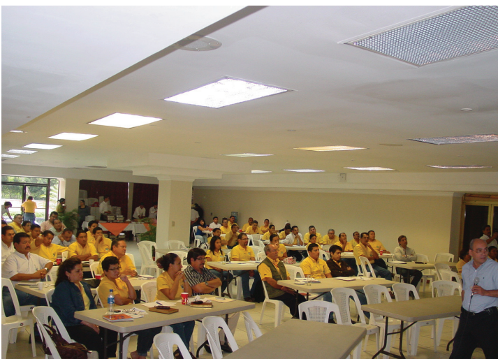
Los funcionarios y empleados del Ministerio de Obras Públicas reciben conocimientos sobre transparencia en la gestión pública y ética gubernamental.

El objetivo de esta medida es acrecentar los conocimientos referidos a transparencia en la gestión pública y sobre ética gubernamental, procurando que exista un mayor empoderamiento de los funcionarios y empleados del MOP para actuar con apertura y manejar adecuadamente los conflictos de interés que puedan surgir en las relaciones con constructores y comunidades. Esta medida funciona desde el inicio de esta administración.