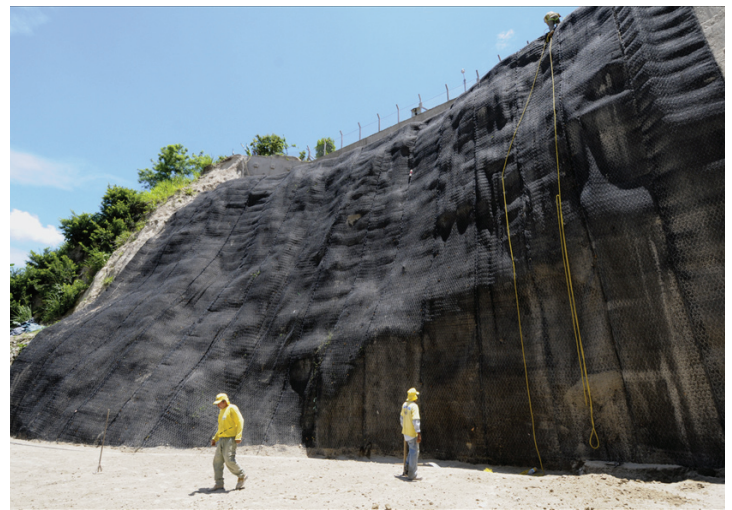
Obras de mitigación en San Bartolo, Ilopango.

Con el fin de enfrentar abusos e ineficiencias dentro del MOP, la entidad determinó con un énfasis especial abrir a la vista pública y agilizar el trabajo de las unidades que forman parte del proceso de desarrollo de una obra física, desde el diseño hasta la construcción. Esta medida fue adoptada desde el inicio de la gestión.