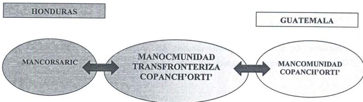
Esquema N° 2 Instancias que forman parte de la Mancomunidad Transfronteriza

Se constituyó en agosto del 2004 en un acto solemne realizado en el municipio de Copan Ruinas, con delegados de ambas mancomunidades y con presencia de autoridades locales y departamentales de Copán, Honduras y Chiquimula, Guatemala. (Entrevista, Guerra: 2007)