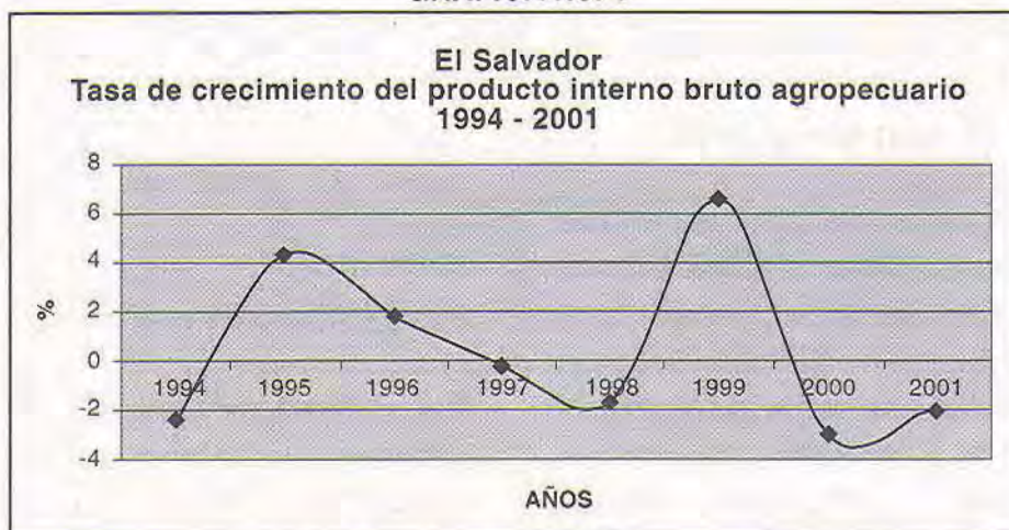
GRÁFICA No. 1