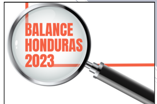
Vea en este enlace los detalles del informe técnico anual del FOSDEH .

En 2023, el Estado hondureño ejecutó el 90% de su presupuesto asignado, la mayoría para pago de salarios y gastos administrativos, por lo que prevalece la deuda con el compromiso social.