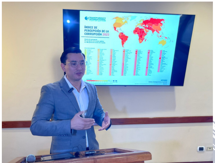
Guatemala, al igual que Honduras, obtuvieron una puntuación de 23 de 100 posibles, lo que los ubica en la posición 154 entre los 180 países evaluados.

ASJ , en Honduras, realizó el foro Corrupción y Justicia en el cual participaron personas expertas que analizaron los retos y posibles razones por las cuales los gobernantes no buscan la transparencia.