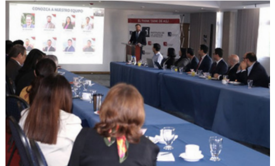
El centro de ideas generará propuestas basadas en investigaciones.

ASJ oficializó la creación del Instituto de la Justicia, un tanque de pensamiento, con personas expertas nacionales y de otros países, que generará análisis, datos y propuestas para temas clave del país y que incidan en el desarrollo.