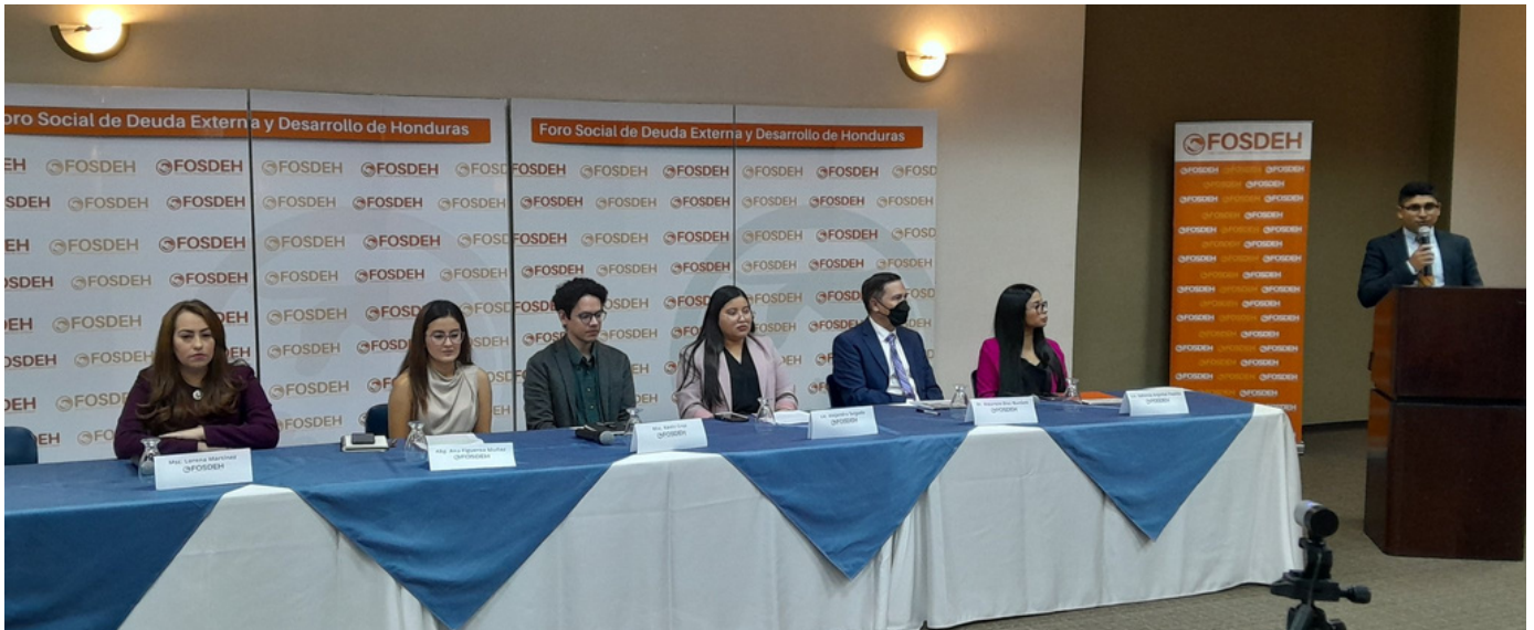
Personas profesionales de las diversas ramas participaron en la presentación del informe sobre la situación de Honduras.