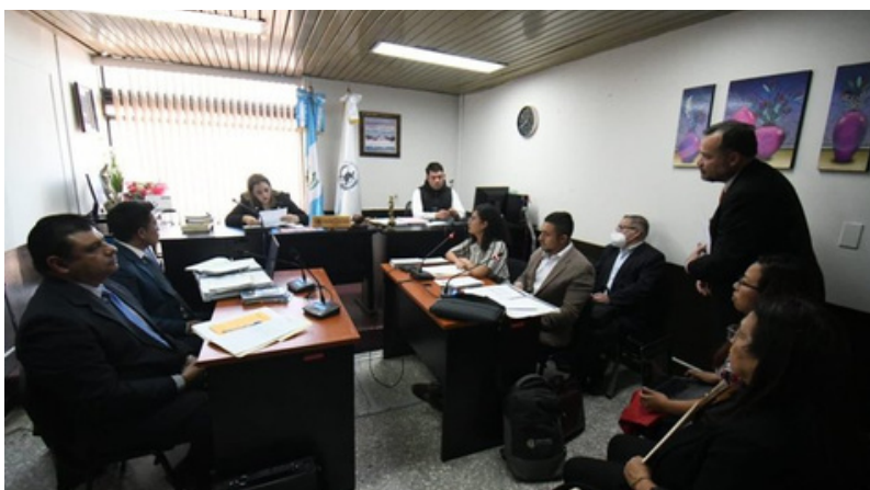
El Ministerio Público de Guatemala sigue criminalizando a seis periodistas y tres columnistas de elPeriódico, entre ellos el fundador de Acción Ciudadana .