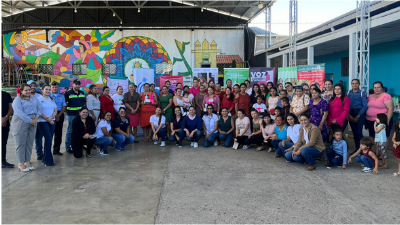
Otra muestra del nulo avance en la lucha anticorrupción es que se reprobó la calificación para acceder a fondos del Gobierno de EE.UU.