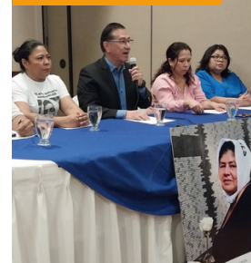
Cristosal denunció que no hay interés en las víctimas.

Cristosal recordó en enero que el Congreso lleva siete años en deuda con las víctimas del conflicto armado, pues la Ley de Amnistía fue declarada inconstitucional y en su lugar no se ha creado una ley de dignificación.