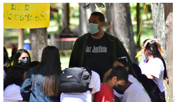
La capacitación se da en sectores vulnerables.

La ASJ capacita a familias de sectores vulnerables sobre cómo romper el ciclo de la criminalidad y la violencia a través del respeto dentro de la familia y de la comunidad.