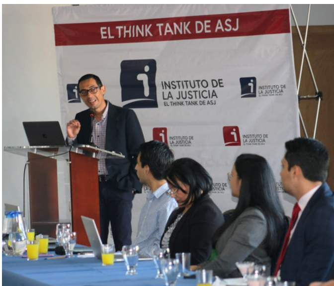
Los ataques contra ASJ se intensificaron luego de que la organización oficializó un tanque de pensamiento que analizará las causas y efectos de la corrupción y de que se pronunciara sobre la alta percepción de corrupción en Honduras en 2023.