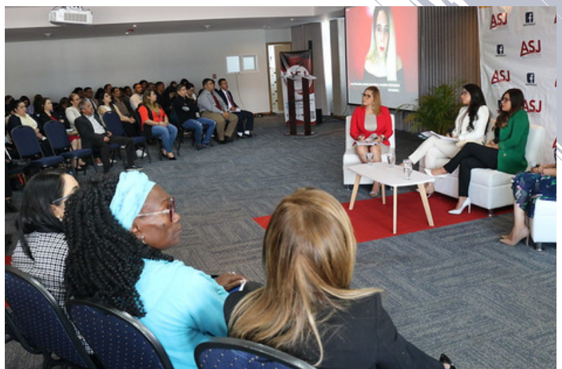
ASJ recordó en el foro Corrupción y Justicia que erradicar la corrupción es una tarea de todos los entes del Estado. Vea aquí el informe .