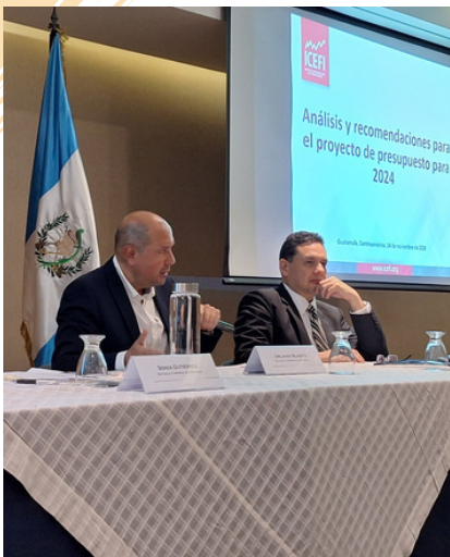
El Icefi analizó en un foro el presupuesto 2024 aprobado por el Congreso y que equivale a unos US$16,000 millones.