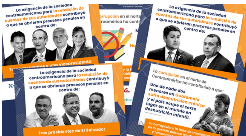
La campaña del CCINOC busca concientizar a la población en Guatemala, Honduras y El Salvador para que luche por sus derechos