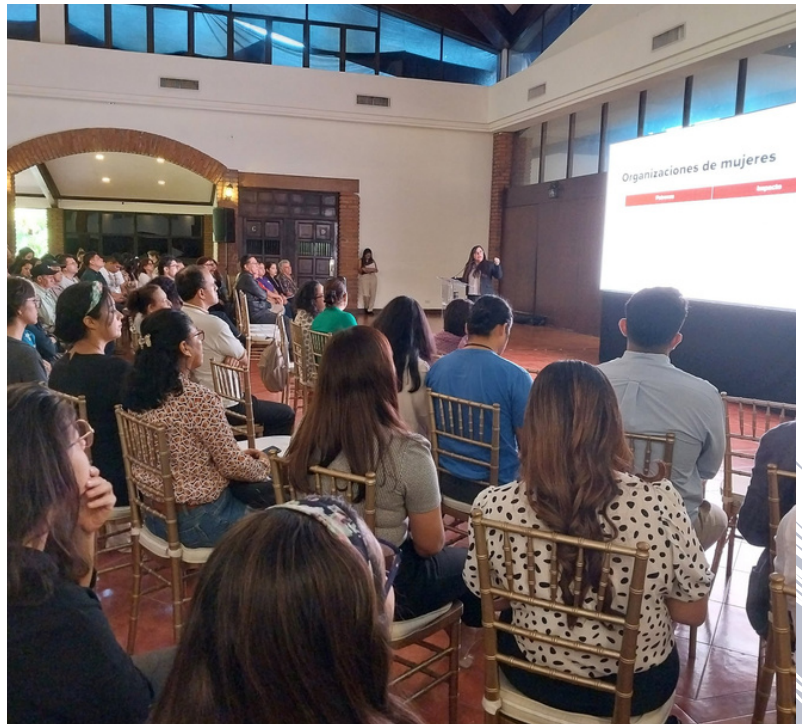
El acoso y criminalización que viven las organizaciones de sociedad civil va en aumento, según el informe de Cristosal que puedes leer aquí .

El estudio Sociedad Civil en Alerta: investigación sobre afectaciones al derecho de asociación expone que las organizaciones enfrentan en el gobierno actual acoso policial, registro arbitrario y abuso de autoridad en sus sedes, acoso y ataques en redes sociales y eliminación de espacios de participación ciudadana. Por décadas, las organizaciones han contribuido al desarrollo social con propuestas de ley, garantía de servicios, defensa del medioambiente, empoderamiento de la mujer y de la organización comunitaria, defensa de víctimas y rescate de la memoria histórica.