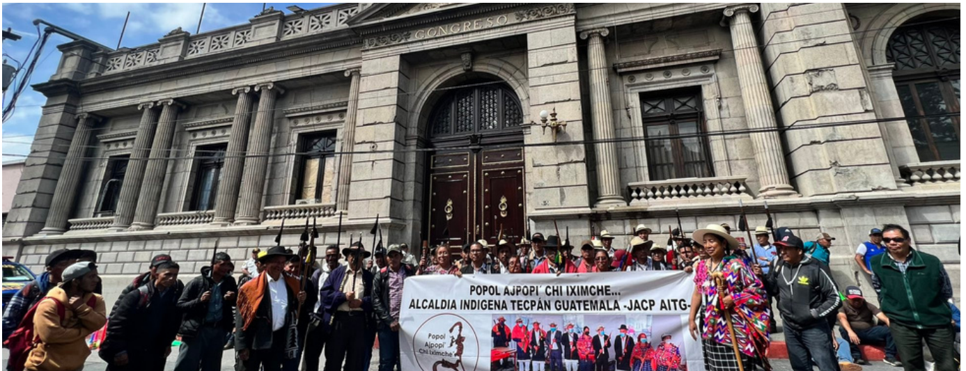
Autoridades indígenas mantienen protestas frente al MP y el Congreso en rechazo a sus acciones contra la democracia.