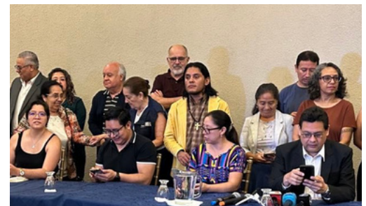
Acción Ciudadana y el Icefi son parte de las organizaciones que luchan por la democracia.

trabajadoras de la universidad estatal les giraron orden de captura y 5 fueron detenidas por participar en una huelga de casi un año en esa casa de estudios.