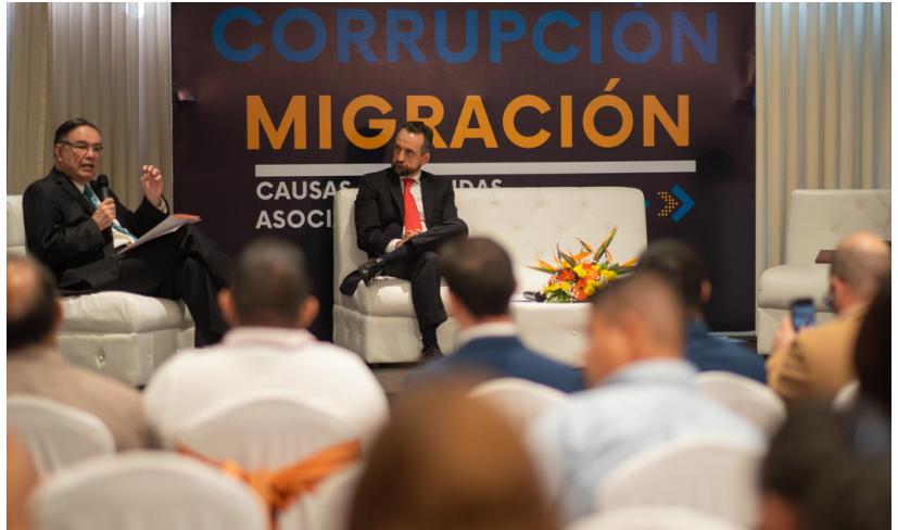
El FOSDEH organizó un foro con personas expertas en corrupción, migración, violencia y derechos humanos y presentó su estudio, el cual puedes leer aquí .

Los resultados del estudio Corrupción-Migración: causas profundas asociadas y relacionadas fueron presentados durante un conversatorio entre autoridades nacionales, personas invitadas internacionales y líderes de sociedad civil.