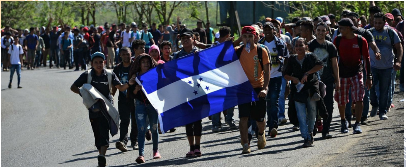
El estudio presentado revela que siete de cada diez personas hondureñas aspiran migrar.