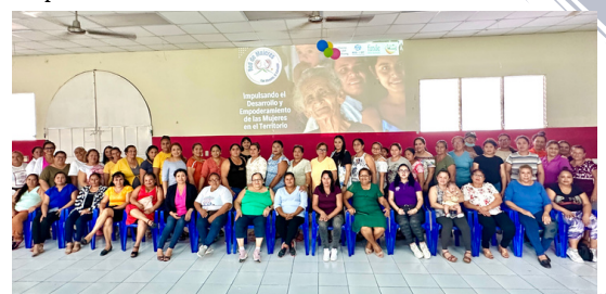
Las lideresas de San Vicente se reunieron con el acompañamiento de Funde .

La Fundación Nacional para el Desarrollo ( Funde ) reunió y capacitó a 70 lideresas de San Vicente para crear un comité coordinador de la red de mujeres de ese departamento.