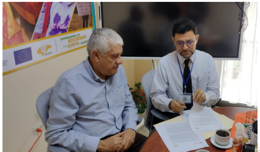
Cristosal y Asonog firmaron el convenio bilateral de formación y cooperación.

La Asociación de Organismos no Gubernamentales ( Asonog ) y Cristosal firmaron un convenio de cooperación interinstitucional para cumplir procesos formativos para personas abogadas que defienden y promueven los derechos humanos (DDHH). Esta especialización será el inicio de un mayor apoyo a las comunidades en su búsqueda de equidad.