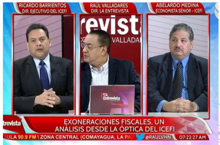
Los directivos del Icefi socializaron las propuestas en Canal 11.

Ambas organizaciones reconocen que es el momento propicio para una reforma fiscal integral en beneficio de la población.