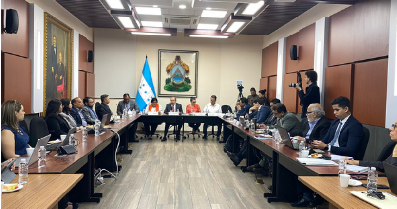
Integrantes del Fosdeh presentaron sus propuestas ante el Legislativo.