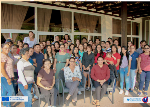
Personas auditoras sociales fueron capacitadas en el occidente de Guatemala.