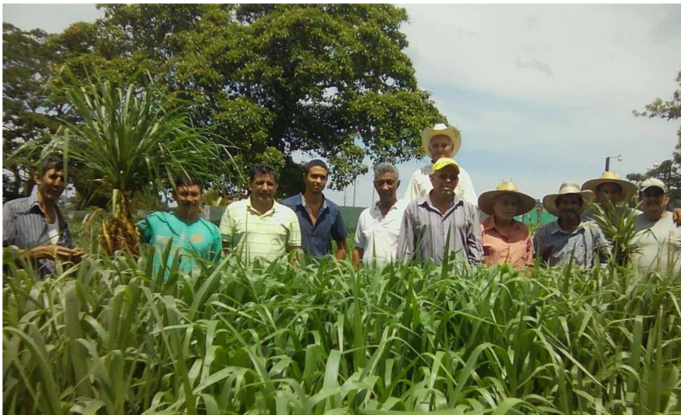
Imagen 4 - Productores que utilizan los insumos biológicos de Bioamigo.

Jesús Constanza, el especialista en agricultura sostenible de CLUSA.