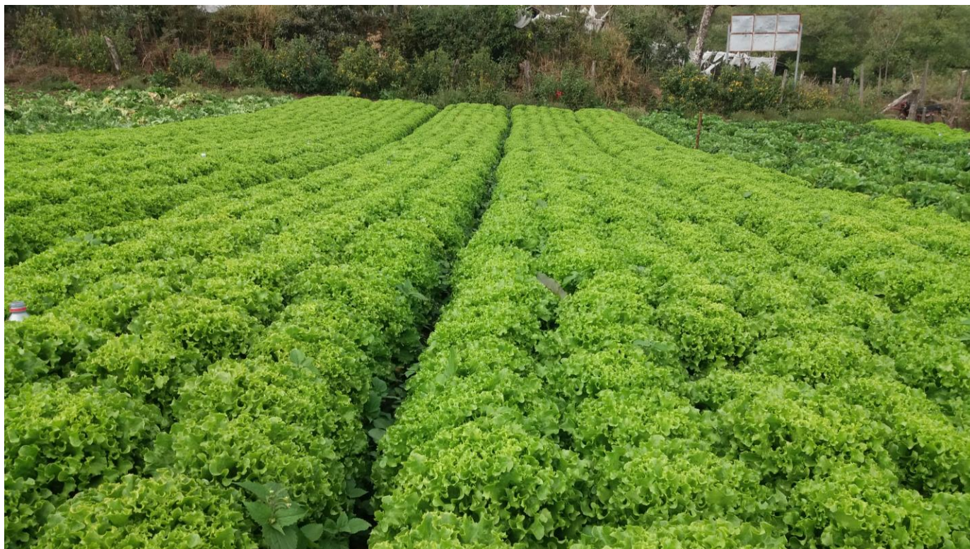
Imagen 2 – Producción con uso de los insumos biológicos de Bioamigo.