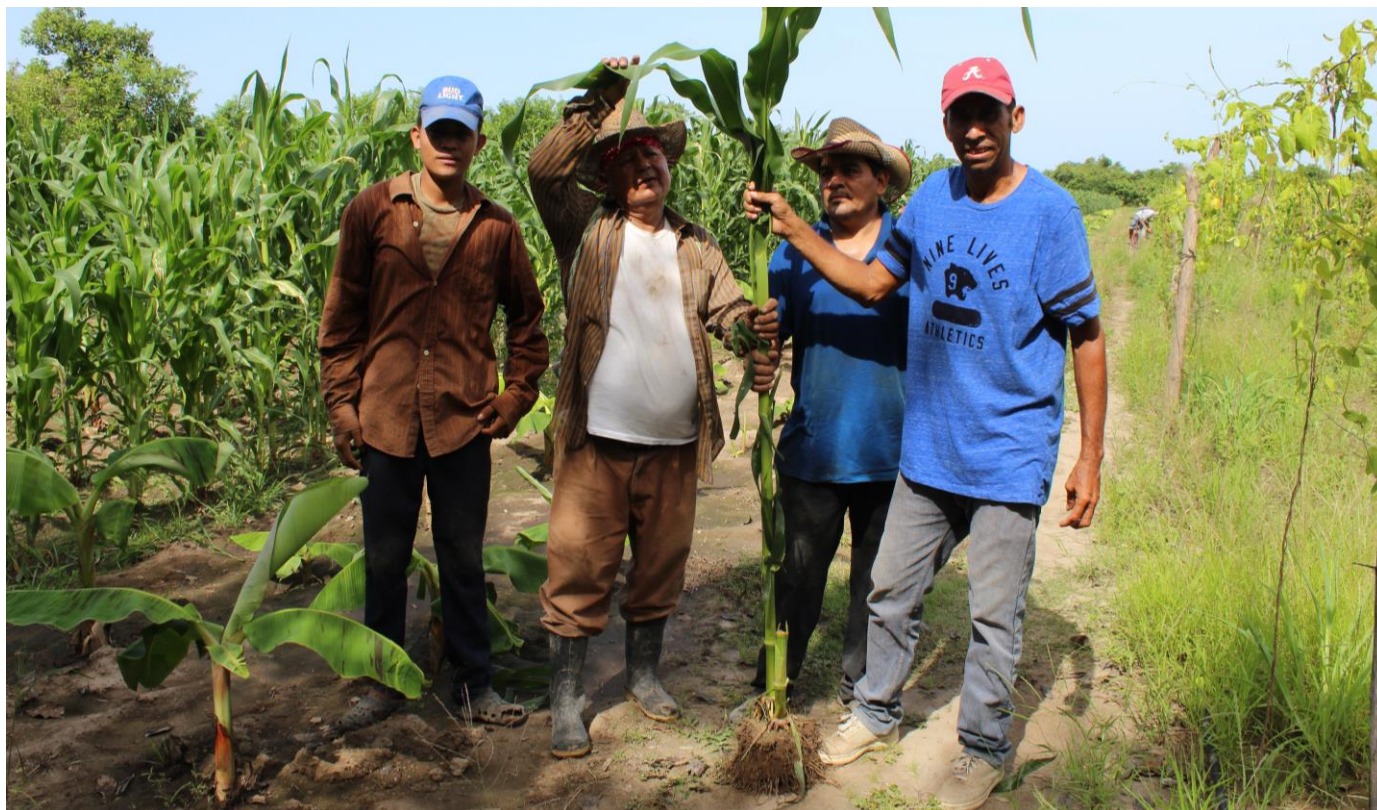
Imagen 3 - Productores que utilizan los insumos biológicos de Bioamigo.