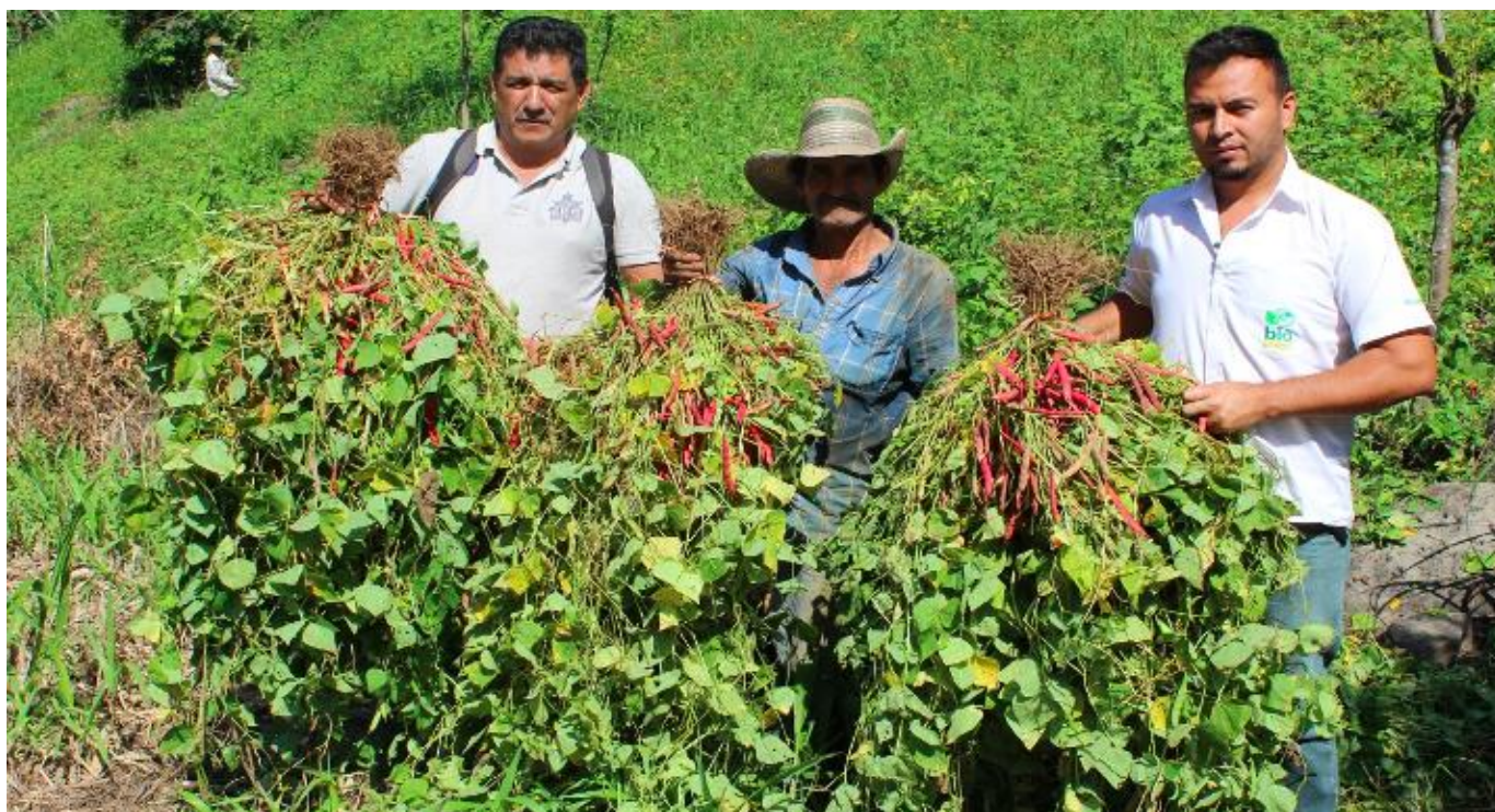
Imagen 1 - Productores que utilizan los insumos biológicos de Bioamigo.

En 2020, se amplía la oferta de insumos orgánicos, con seis nuevos productos, y se inicia el desarrollo de procesos de investigación con cepas de microorganismos nativos. Este año, afectó la pandemia del COVID 19. Si bien la agricultura no paró sus actividades productivas, por ser un sector estratégico; las medidas de distanciamiento social, la cuarentena obligatoria y los efectos en la salud de la población, afectaron el normal funcionamiento de la Planta de producción. Con relación a las capacitaciones y mercadeo, se reducen los contactos personales, y se intensifica el uso de las redes digitales. En el 2021, mejora el trabajo de campo, flexibilizando las condiciones frente a la pandemia, permitiendo el normal desarrollo, al grado que la marca Bioamigo ya viene se posicionando en el mercado y se tiene presencia con los productos a nivel nacional.