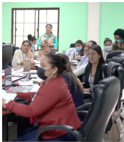
Esta capacitación se inició en municipios del departamento de Ocotepeque.

Con el objetivo de erradicar la brecha de desigualdad en los liderazgos de las comunidades y en los gobiernos locales, ASONOG ha organizado capacitaciones en por lo menos 16 oficinas municipales de la mujer, con las cuales busca la organización necesaria de ellas para incidir en la toma de decisiones.