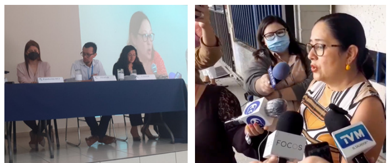
1) Las organizaciones denuncian que el Gobierno está cometiendo delitos de lesa humanidad. 2) Cristosal presentó una inconstitucionalidad a la creación de jueces y magistrados sin rostro, tras la modificación al Código Procesal Penal.