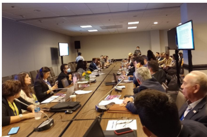
En mesas de trabajo las diferentes organizaciones y entidades lograron acuerdos de gestión para la región.