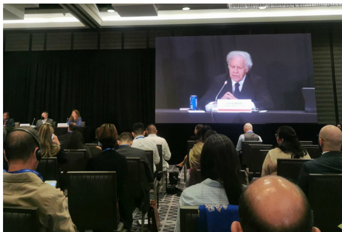
Luis Almagro, secretario general de la OEA, reconoció que la desigualdad y la violencia crecen en el continente.