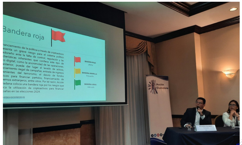
Acción Ciudadana considera que si no se regulan las monedas virtuales, serán usadas como una forma irregular de financiamiento para campañas políticas.

La preocupación radica en la recaudación de fondos para financiar campañas políticas para las elecciones legislativas y municipales de 2024. Aún hay tiempo y por ello han pedido legislarlo pronto.