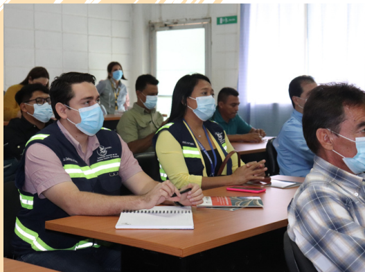
Con este curso FOSDEH busca capacitar sobre la buena gobernanza en el Estado y el sector privado.