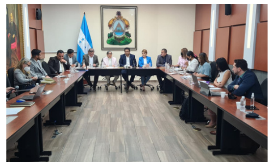
Delegados de ASJ se reunieron con la Comisión de Legislación y Asuntos Constitucionales del Congreso.

La ASJ ha sostenido reuniones con entidades que conforman la Junta Nominadora de candidatos a magistrados de la CSJ, pues busca incidir en la toma de mejores decisiones en el listado de candidatos al Congreso. Se ha conversado con comisiones y bancadas del Congreso, facultades de Derecho, el Colegio de Abogados y la Comisionada de Derechos Humanos, para que se adopten estándares de transparencia y una postulación abierta.