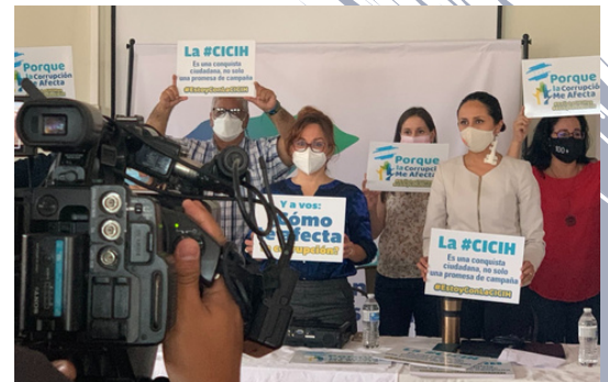
Han sido 29 organizaciones las que se unieron para crear este nuevo frente contra la corrupción.

Cristosal y ASONOG dieron a conocer su incorporación a la Articulación Ciudadana Transparencia y Justicia, a través de la cual buscan incidir, junto a otras 27 organizaciones, en la pronta instalación de la Comisión Internacional contra la Impunidad en Honduras (CICIH), una elección de magistrados honorables para la CSJ y apoyar el fortalecimiento de la Unidad Fiscal Especializada contra Redes de Corrupción.