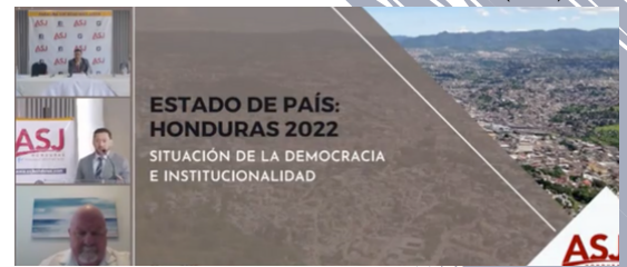
Los informes temáticos son presentados cada semana.