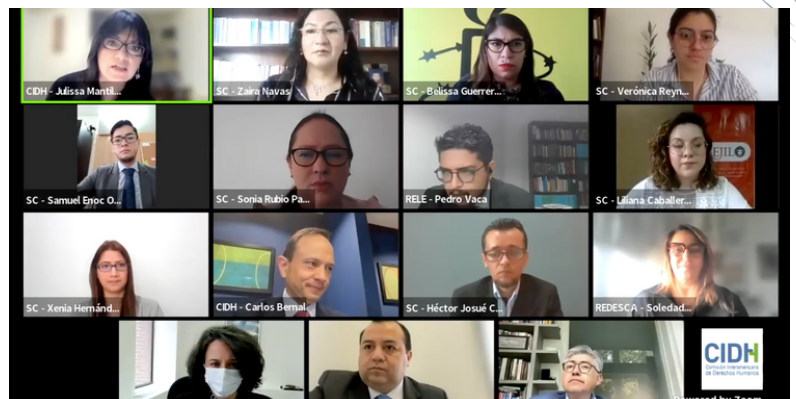
Este mes fueron denunciados ante la CIDH los vejámenes que ocurren en el país.

Cristosal ha documentado al menos 52 fallecidos en prisión, cientos de denuncias de detenciones arbitrarias, alegando que no son pandilleros como la Policía los acusa. El Congreso también ha modificado leyes que violentan garantías constitucionales como la de la Carrera Judicial y la creación de la figura de "jueces sin rostro".