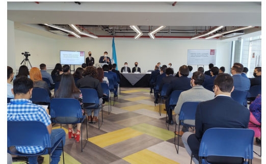
El SAR ahora cuenta con la asesoría de expertos fiscales de ICEFI para la asignación de recursos.

El Instituto Centroamericano de Estudios Fiscales ( ICEFI ) y el Servicio de Administración de Rentas ( SAR ) buscan fortalecer la fiscalización de los ingresos del Estado a través de un mejor monitoreo del movimiento del dinero y también de las asignaciones que el gobierno les da. Es por ello que firmaron un convenio de cooperación para que el instituto les apoye en esa labor de control.