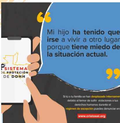
Cientos de familias están en el desamparo jurídico ante el Régimen de excepción.

El presidente Alejandro Giammattei designó para un período más a Porras, quien desde 2021 ha sido designada dos veces por EE. UU. como un actor corrupto y antidemocrático y ya no cuenta con visa para ingresar a ese país.