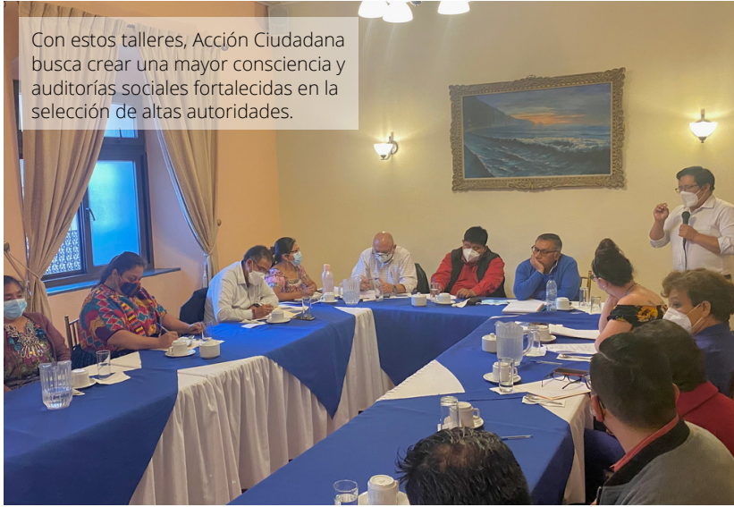
Con estos talleres, Acción Ciudadana busca crear una mayor conciencia y auditorías sociales fortalecidas en la selección de altas autoridades.