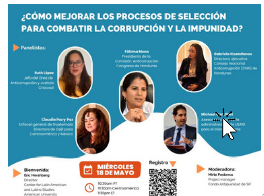
Vea aquí la grabación del foro.