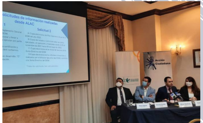
Los expertos revelaron la evasión de controles para gestionar los proyectos Tren y Aeropuerto del Pacífico y centros penales.

Según la denuncia pública, estos proyectos no deben tener una normativa propia, sino que deben regirse por la legislación vigente para compras y contrataciones. Esto garantizaría una libre competencia y transparencia entre proveedores.