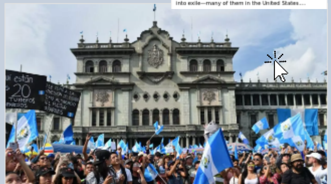
El Gobierno de Guatemala optó por la corrupción y Estados Unidos debe...