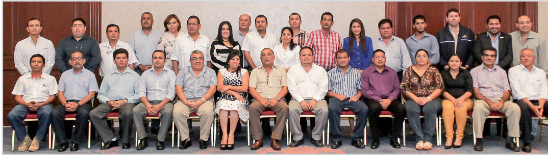
Alcaldes, Alcaldesas y Gerentes firmantes del acta de creación de la Red de Mancomunidades

El día 22 de septiembre de 2015, en la Ciudad de San Salvador, se realizó el evento de “Constitución de la Red de Mancomunidades de El Salvador”, que contó con la participación los alcaldes, alcaldesas y gerentes representantes de las asociaciones de municipios de diferentes regiones del país.